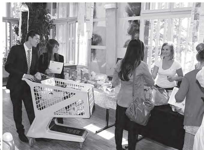
Cash-cash party. Super marché.

Un projet de mallette pédagogique élaborée par un groupe de travail réunissant les quatre CSP est en attente de réponse à une demande de financement. Lorsque ce projet verra le jour, les Ficelles du Budget traverseront les frontières neuchâtelaises et deviendront romandes.