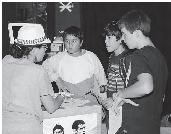
Cash-cash party. Loisirs et budget.