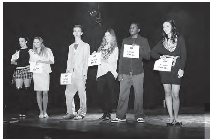
Cash-cash party. «Chic et pas cher»

Les ateliers sont animés par des professionnels du travail social et éducatif, délégués par une vingtaine de services et institutions neuchâtelaises. Cette collaboration interinstitutionnelle permet de répondre aux demandes croissantes des écoles. La diversité des expériences des collègues travaillant sur le