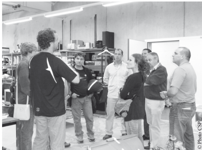
Accueil de l'équipe de volontaires SIG à La Renfile

Depuis plusieurs années, le CSP développe des collaborations avec les entreprises. Quelques-unes, telles KPMG, J.P. Morgan, UBS, Axa Winterthur (Axa Tout Cœur), ALCOA, ont œuvré avec nous à une action particulière, déterminée et tenant compte de plusieurs facteurs: le besoin de l'institution, le nombre de collaborateurs bénévoles, les motivations et possibilités de l'entreprise. Le 17 juin dernier, nous avons accueilli une dizaine de volontaires des SIG (Services Industriels de Genève) dans le cadre de leur journée de solidarité. Les SIG avaient organisé une collecte de vêtements dix jours avant la manifestation et ont récolté plus de 300 kilos de vêtements.